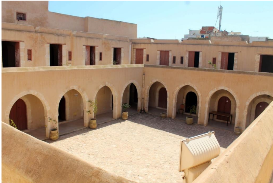
3. فندق الحدادين 59