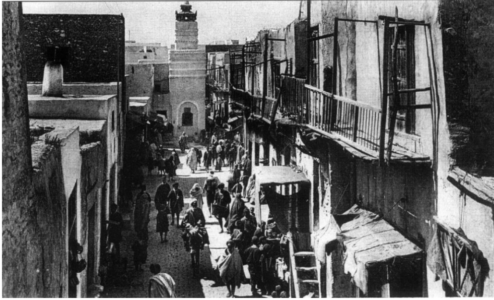
4. بطاقة بريدية من نهاية القرن التاسع عشر وفيها سوق الحدادين ورحبة الذبح قرب مسجد سيدي بوشويشة (آخر الصورة)، والدكاكين محل النزاع على يسار الصورة