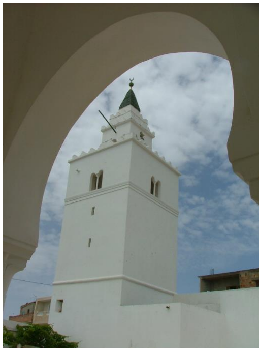
3. غار الملح: مئذنة الجامع الكبير الحنفي

ويعود تاريخ إنشاء الجامع الكبير بغار الملح إلى أواسط القرن السابع عشر وبالتحديد إلى سنة 1070/1659، وذلك حسب نقيشة تأسيسية كتبت باللغة التركية بخط ثلثي طعمت بالرصااص على لوحة من الرخام أبيض اللون 6 . ويتزامن بناء الجامع مع فترة حكم حمودة باشا التي تمتد من سنة 1631 إلى سنة 1666. شهدت الايالة خلالها العديد من الإنجازات المعمارية، نذكر منها بناؤه لجامعه المعروف بجامع حمودة باشا بتونس وزاوية الصحابي أبي زمعة البلوي بالقيروان والجامع الكبير ببنزرت وغيرها من المنشآت الأخرى.