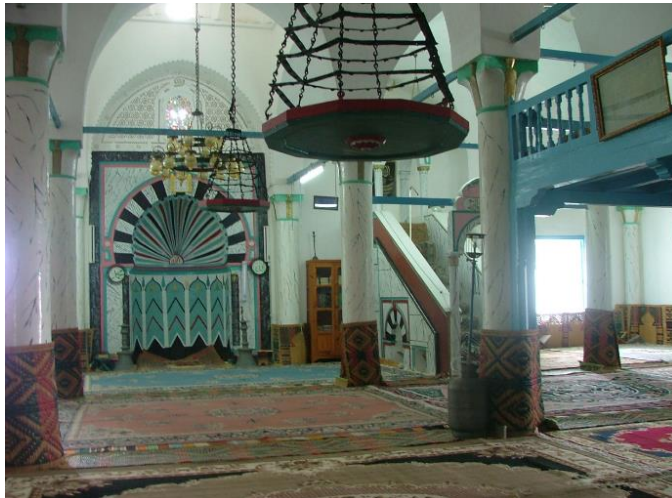
5. غار الملح: بيت الصلاة بالجامع الكبير