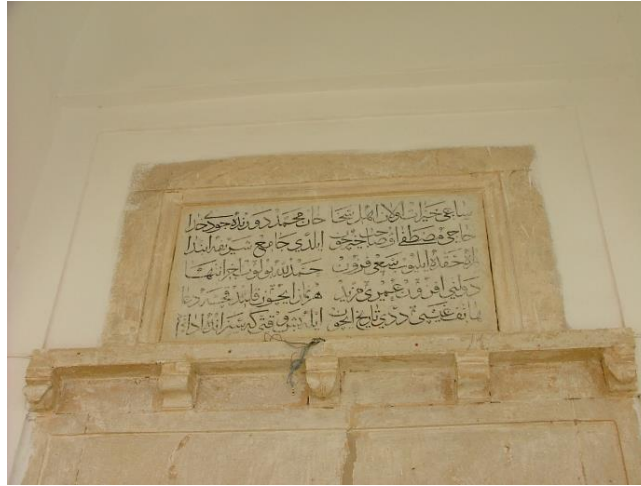
4. غار الملح : النقيشة التي تؤرخ لتأسيس الجامع الكبير الحنفي

وقد تعرض الجامع الكبير بغار الملح في السنوات الأخيرة إلى العديد من الترميمات والتغييرات الطفيفة، لكنه ما زال يحافظ على معالمه المعمارية الأصلية، وابتداء من القرن الثامن عشر تواتر ذكره بوثائق الأرشيف وأهمها الوثيقة التي نحن بصدد دراستها، لكن أغلب الوثائق تعود إلى القرن التاسع عشر والقرن العشرين وهي تعكس أهمية هذا الجامع من خلال وفرة أحباسه وتنوعها.