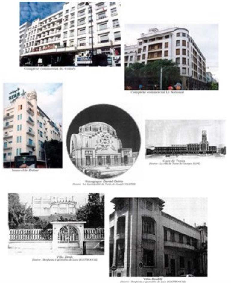
Fig.18. Quelques édifices de style art déco

Une présence significative d'édifices art déco est remarquable dans les quartiers Lafayette et Le passage. Ils sont le produit d'initiatives individuelles de riches commanditaires, essentiellement de la communauté juive, avec des dimensions variables selon les emplacements. Les autres bâtiments, aux allures art déco peu prononcées, sont éparpillés dans les différentes artères de la capitale. En effet, il est essentiel de distinguer les bâtiments qui incarnent véritablement le style art déco, tant par leurs conceptions architecturales que par les éléments décoratifs des façades, de ceux qui s'en rapprochent simplement en intégrant quelques détails subtils, tels les grilles et balustrades en fer forgé ou les médaillons au-dessus des fenêtres, sur une façade qui demeure de conception classique (corps central et corps latéraux) (fig.18).