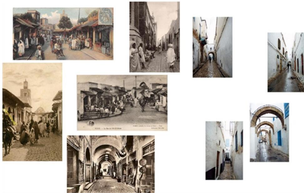
Fig. 3. Quelques vues sur différents réseaux viaries publics et privés de la Médina de Tunis