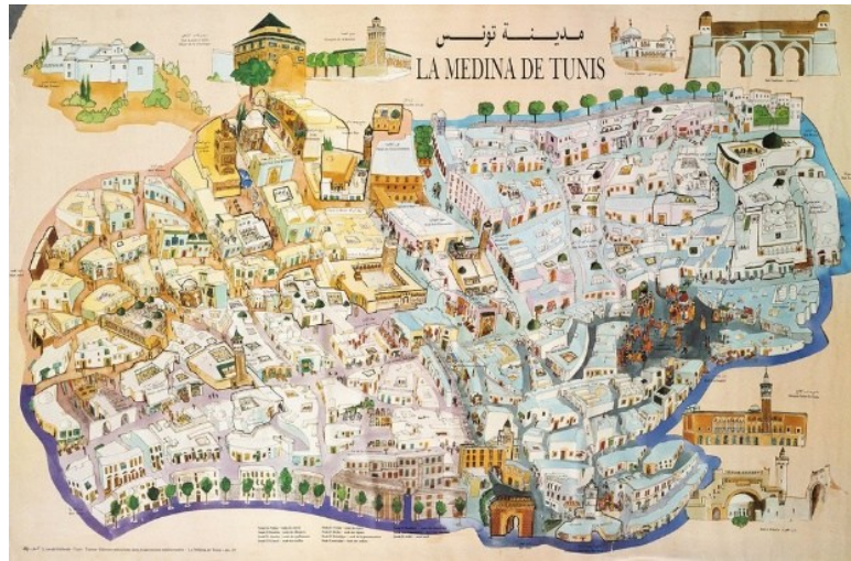
Fig. 2. Le réseau viare du noyau central de la médina de Tunis