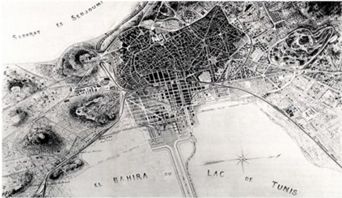
Fig.12. Plan de la ville nouvelle de Tunis et diverses extensions aux proches alentours du vieux noyau Source : Tunis, le creuset méditerranéen de Serge SANTELLI

La capitale devient alors le résultat d'une « juxtaposition » de deux entités urbaines radicalement différentes : une ville nouvelle, bien quadrillée, destinée principalement à l'accueil d'une population étrangère variée (Français, Italiens, Maltais et Anglais, Juifs livournais et quelques familles musulmanes aisées) ; une ville ancienne, plutôt organique, qui n'a pratiquement pas changé durant toute la période du Protectorat et qui continue d'être occupée majoritairement par une population locale musulmane et juive, avec une modeste minorité chrétienne (fig. 12).