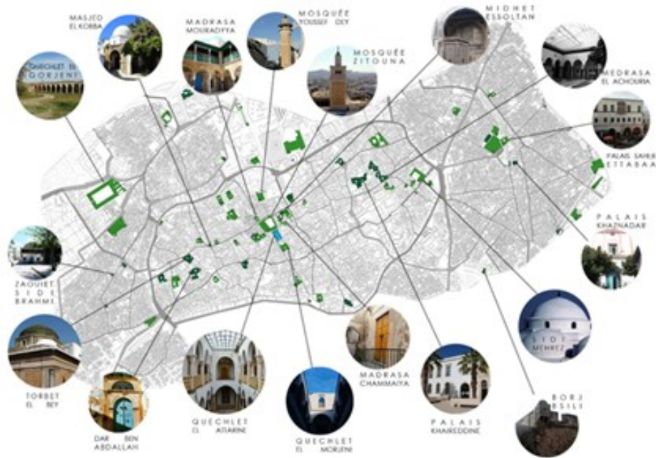
Fig. 4. Principaux monuments de la médina de Tunis et ses faubourgs