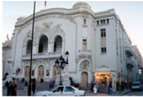
Théâtre municipal (TNT) construit sur l'avenue de Jules Ferry