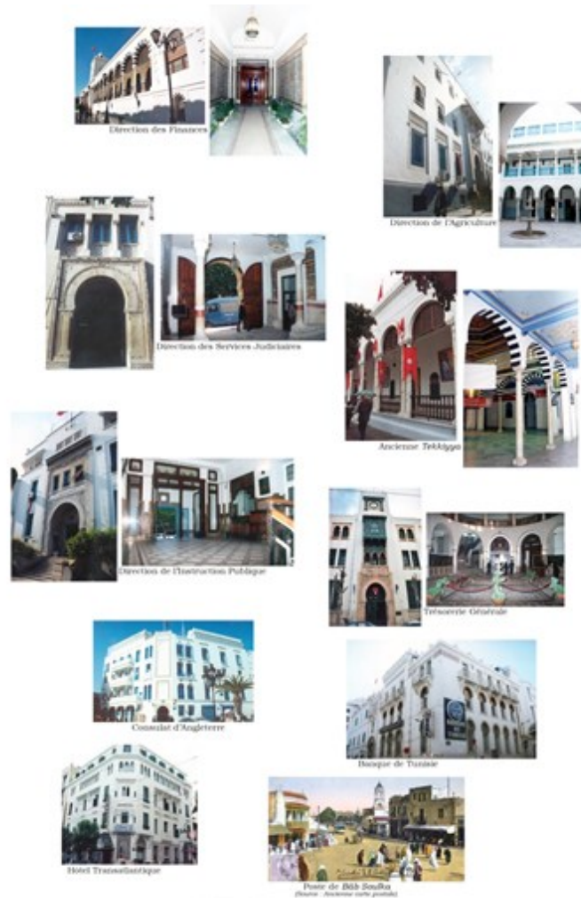
Fig.19. Quelques édifices de style néomauresque

Le mouvement néomauresque, sans doute lié à la montée d'une architecture régionaliste, puise dans les traditions artistiques locales afin d'insuffler un « cachet tunisien » aux constructions modernes et de mieux intégrer le patrimoine bâti traditionnel dans le paysage urbain, aux allures occidentales, des nouvelles villes du Protectorat. Les techniques employées varient, allant de l'imitation la plus directe à l'adaptation la plus subtile (fig.19).