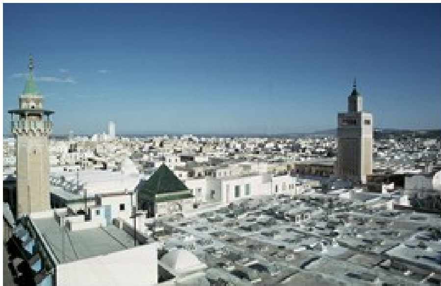
Fig.6. Une architecture essentiellement horizontale rythmée par quelques éléments verticaux

Cependant, malgré cette simplicité apparente des constructions hafsides, certains éléments architecturaux se démarquent par leur verticalité et leur symbolisme jouant le rôle de repères visuels dans la ville, tels les minarets et les coupoles de formes variées (fig. 6).