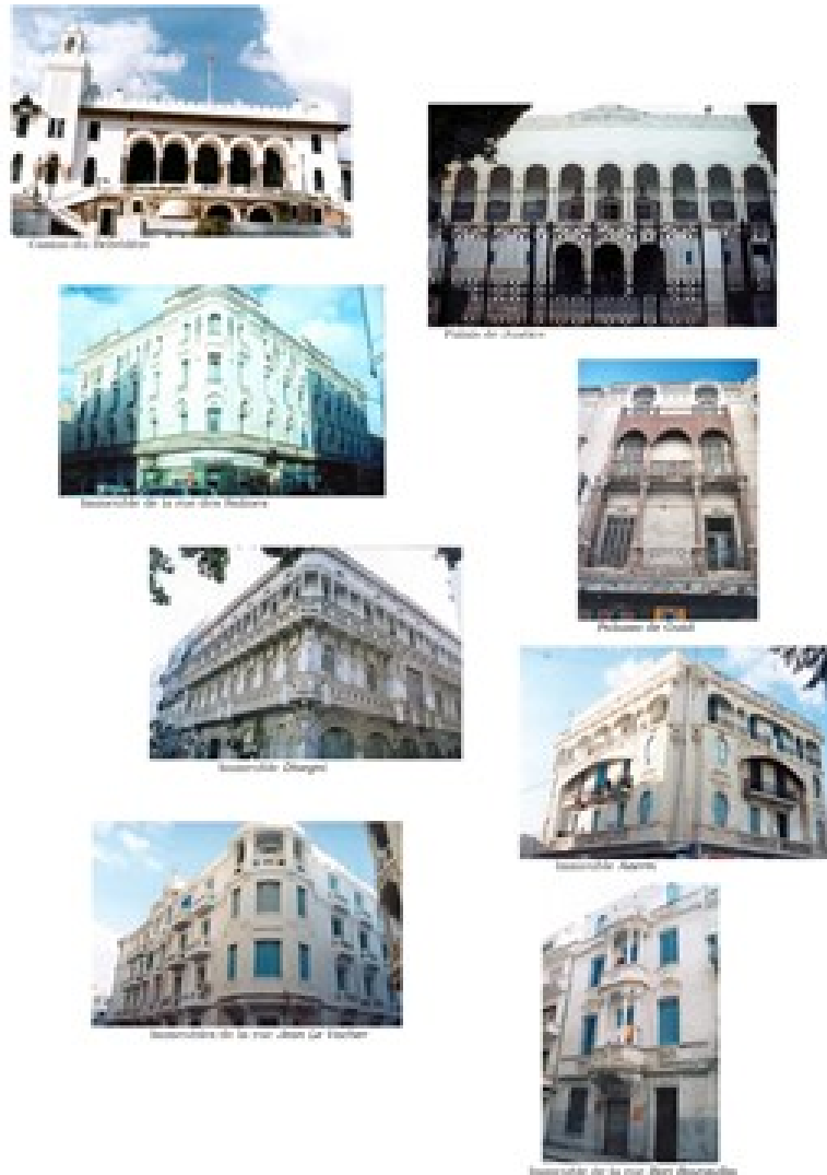
Fig.17. Quelques édifices de style art nouveau