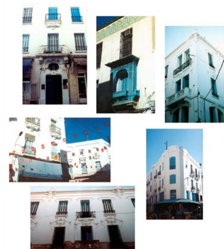
Fig.15. Quelques édifices art nouveau de la rue Léon Roches

Hormis la rue Léon Roches (actuelle rue Mustapha M'barek) à la sortie Est de la médina et l'intersection de l'avenue de la Marine (actuelle avenue Habib Bourguiba) et de l'avenue de Carthage, qui regroupent une forte concentration d'édifices de style art nouveau, les autres constructions de ce même style sont dispersées et isolées le long des grandes artères de la ville coloniale de Tunis (fig. 15 et 16).