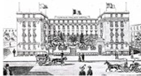
Hôtel Tunisia-Palace sur la place de Carthage, époque de l'indépendance