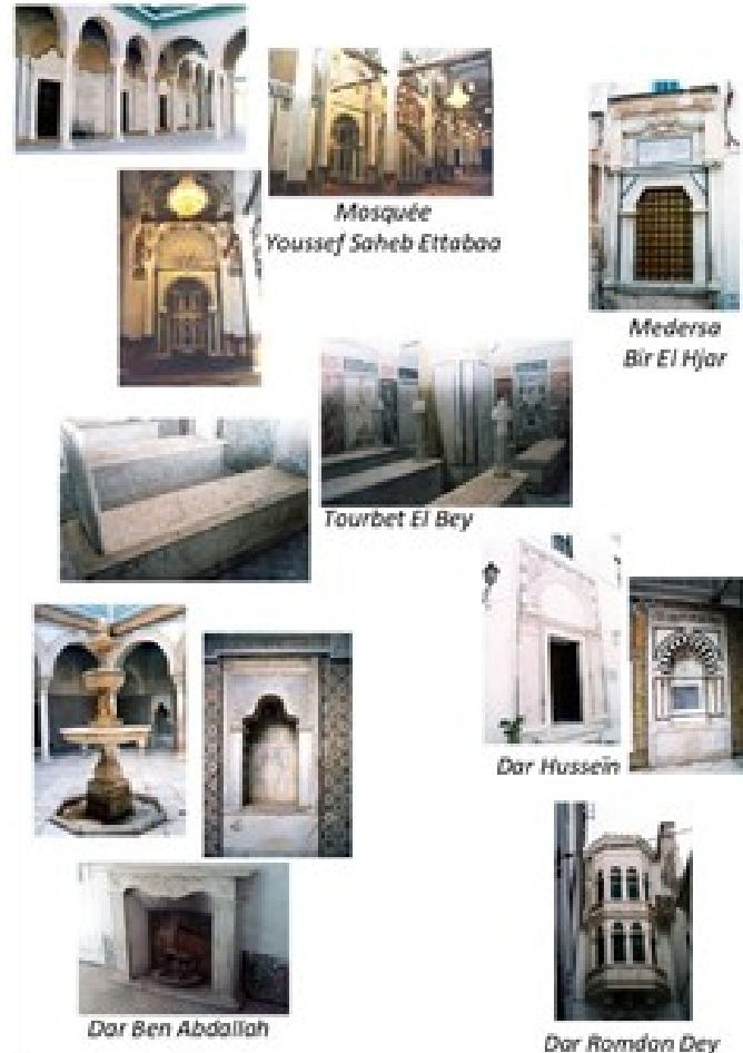
Fig.8. L'accentuation de l'influence occidentale en construction touchant d'autres éléments architectoniques et décoratifs intérieurs et extérieurs

Au départ, cela était limité à quelques habillages extérieurs au niveau des façades, avec l'ajout de motifs et de matériaux décoratifs d'origine occidentale. Progressivement, cette influence commence à toucher les aménagements intérieurs et configurations spatiales (Planche 8). Ce processus de transformation a constitué une étape cruciale dans l'évolution de la médina au cours des décennies à venir.