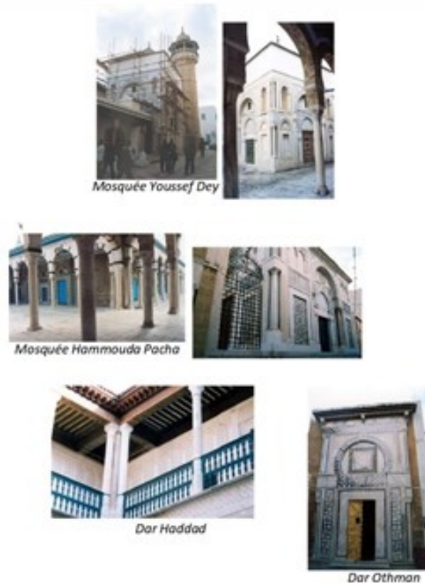
Fig.6. Le début de l'influence occidentale dans de nombreux monuments de la Médina de Tunis et ses faubourgs

Contrairement à la simplicité et à l'austérité de l'architecture hafside, les constructions ottomanes, essentiellement celles des XVIII e et XIX e siècles, se démarquent par leur ampleur et leur richesse architecturale et décorative faisant usage d'une gamme variée de matériaux et motifs importés reflétant plusieurs influences. Cette diversité stylistique n'évoque pas seulement les influences locales, andalouses et ottomanes, mais présente une ouverture sur l'Occident avec des touches d'influences européennes, essentiellement italienne et française, créant ainsi un contraste frappant avec l'héritage des siècles antérieurs (fig. 7). En effet, le paysage urbain de la médina de Tunis dévoile une architecture et une décoration plus soignées et plus élaborées indiquant une nette touche de modernité qui ne fera que s'accroître avec le temps.