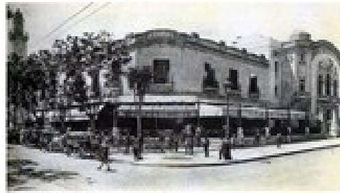
Casino-Palais de la Ville de Tunis et l'avenue de Carthage. Musée de la Ville de Tunis