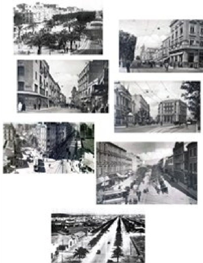
Fig.13. Vues de quelques artères majeures de la ville nouvelle de Tunis aménagées après l'établissement du Protectorat français