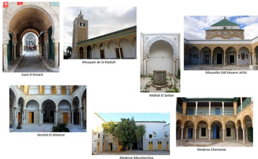
Fig.5. Quelques monuments hafsides avec différentes influences

Cependant, malgré cette simplicité apparente des constructions hafsides, certains éléments architecturaux se démarquent par leur verticalité et leur symbolisme jouant le rôle de repères visuels dans la ville, tels les minarets et les coupoles de formes variées (fig. 6).