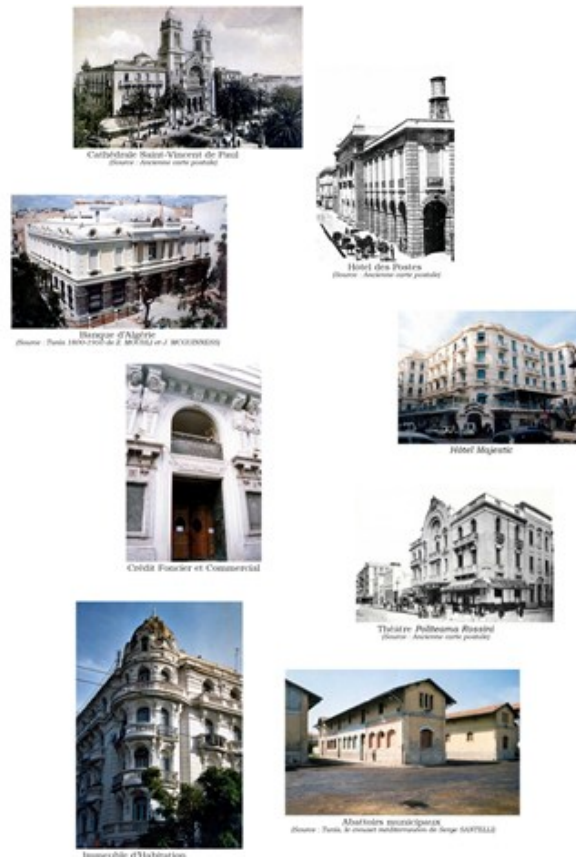
Fig.14. Quelques édifices de style éclectique

Les nouveaux gouverneurs du pays, adoptant une attitude de dominateurs, mettent en place un quadrillage urbain en damier et édifient des bâtiments témoignant de la force de la présence française en Tunisie. Les formes urbanistiques, architecturales et décoratives, qui s'inspirent d'un style inédit pour la capitale Tunis, s'inscrivent dans une tendance éclectique mélangeant des éléments de divers courants occidentaux (haussmannien, grec, romain, byzantin, roman, gothique, baroque, classique...) avec des conceptions et des assemblages innovants (fig. 14).