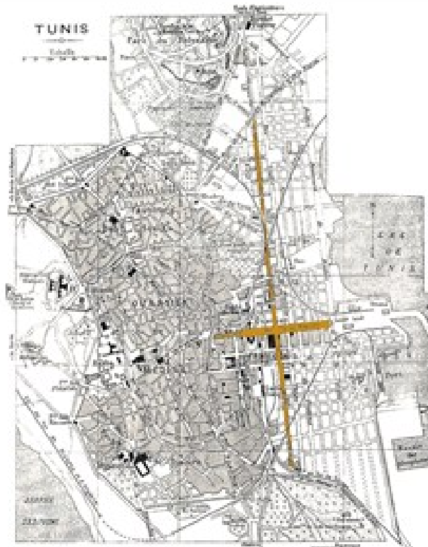
Fig.11. Première ébauche de la ville nouvelle de Tunis structurée autour de deux axes principaux

Au fil des années, une série de rues secondaires, bien droites et alignées, se ramifient autour des deux axes inauguraux de la ville européenne contribuant ainsi à façonner le nouveau centre moderne de Tunis qui s'enveloppe d'un ensemble de banlieues repoussant les limites de l'agglomération (fig. 11).