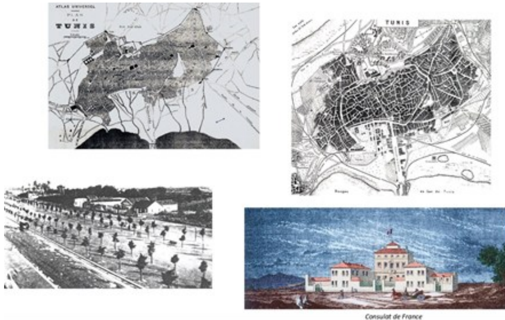
Fig. 10. Début de l'extension urbaine de la ville de Tunis en dehors de ses limites habituelles

L'année 1860, époque de construction du Consulat de France sur un terrain marécageux en dehors de l'enceinte de la ville de Tunis, représente un moment clé dans son expansion urbaine qui allait transformer la capitale de manière significative juste après l'établissement du Protectorat français. L'émergence de l'axe Est-Ouest, qui relie Bâb B'har au Lac (l'ancienne promenade de la marine), symbolise l'extension de Tunis au-delà de ses frontières historiques de façon progressive et irréversible, alors qu'auparavant elle était habituée à un rythme plus lent et mesuré d'accroissement au sein de son périmètre traditionnel (fig.10).