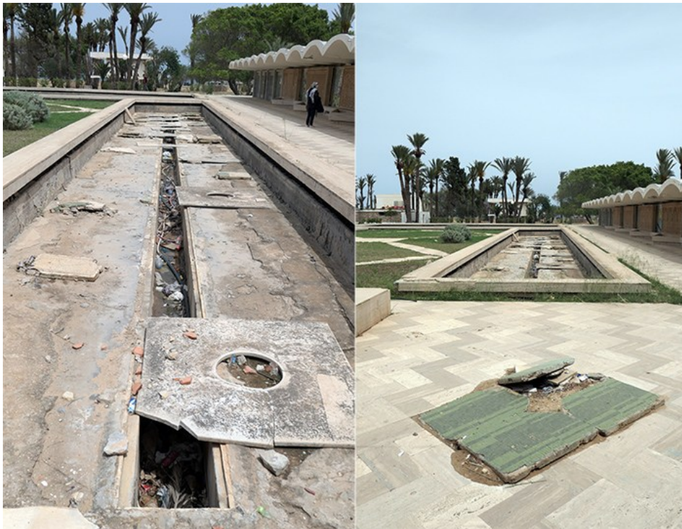
Fig. Etat du bassin extérieur Sources : Jaïdi, 2023

Ce musée, Monument Historique classé, souffre d'un manque d'entretien chronique et certains de ses éléments sont sérieusement dégradés ou vandalisés (les fresques en faïence, les bassins, les villas extérieures, etc). En avril 2023 le Ministère de la Culture avait effectué une opération de nettoyage, sans restauration, qui a été suivie du retour progressif des déchets divers qui polluent le site. A ce sujet Houcine Jaïdi, ancien professeur de l'Université de Tunis a écrit le 18 mai 2023 en conclusion d'un long article illustré dans le magazine en ligne Leaders :Le traitement réservé au Palais présidentiel de Skanès depuis son classement en tant que monument historique, il y a vingt-et-un an et sa gestion en tant que musée depuis dix ans illustrent tragiquement deux défaillances majeures de la gouvernance du patrimoine culturel du pays. Faut-il croire que ce secteur est un sujet trop sérieux pour le ministère des Affaires culturelles qui le gère à la petite semaine sans aucune politique déclarée publiquement ?