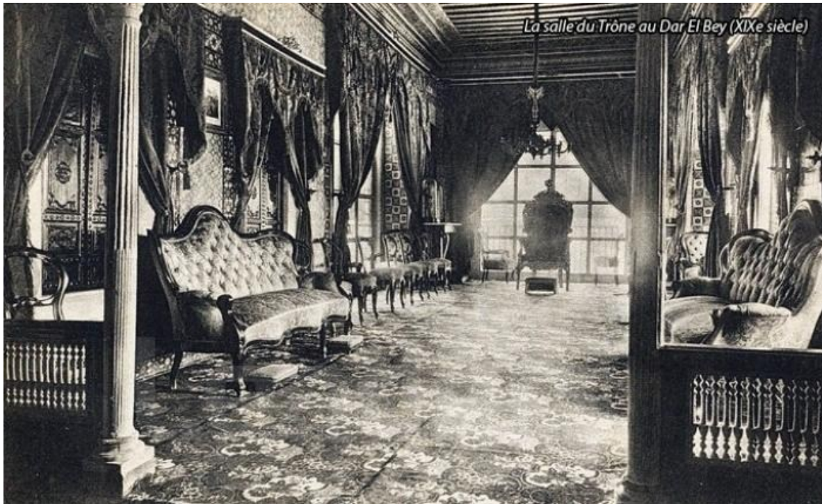
Fig.1. Dar el Bey salle du trône au XIX e siècle

Même si les husseinites ont préféré habiter au Bardo, Dar el Bey a été réaménagé en 1795 par Hamouda Pacha (Husseinite, 1759-1814, mort au Bardo). Le Dar el Bey reste une résidence officielle et la résidence des hôtes du bey, il a été surélevé pour installer appartements, salles de réception et salles d'audiences. Au XIX e siècle, Ahmed Bey (1837-1855) et Sadok Bey (1859-1882), tout en faisant des extensions et réaménagements au Bardo, embellissent Dar el Bey avec des éléments décoratifs : panneaux de nakcha hadida, plafonds peints et carreaux de faïence d'influence italienne et espagnole. Le Bey ne demeure à Dar el Bey qu'à l'occasion des fêtes du Moulded et des Aïds.