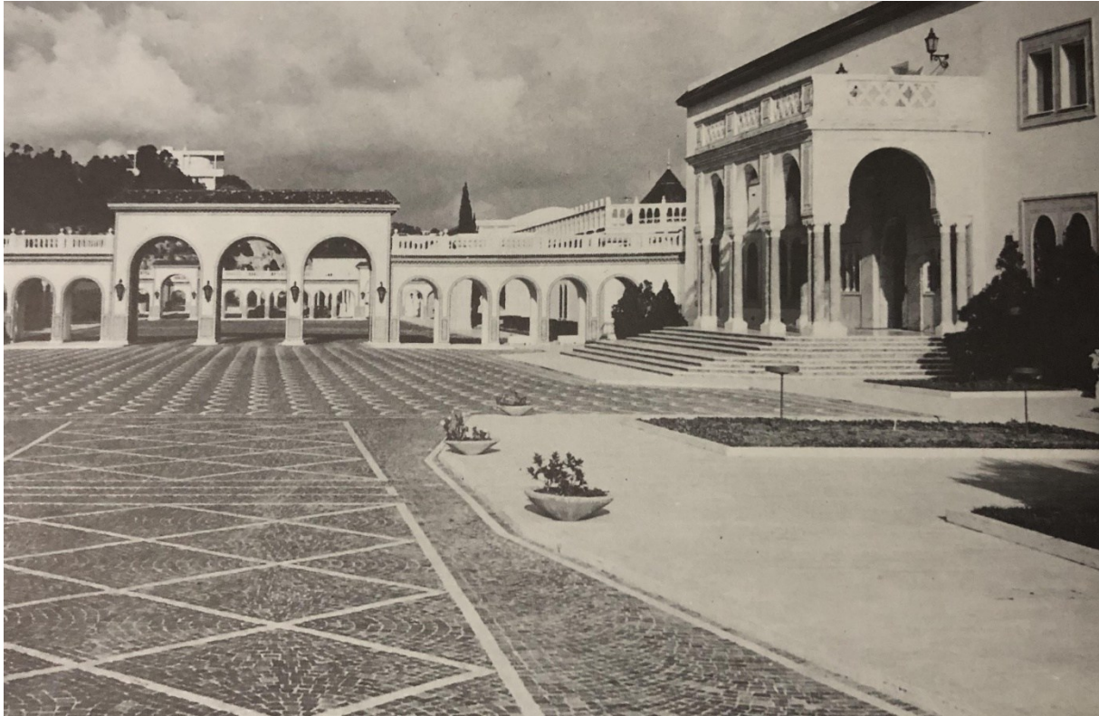
Fig.3. Palais de Carthage la cour d'honneur.