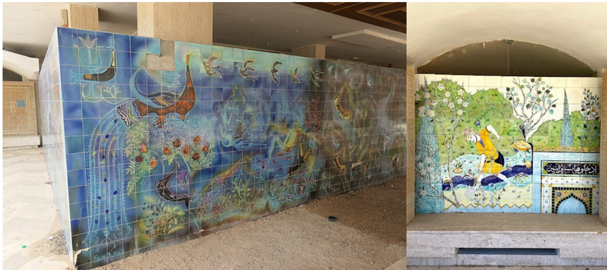
Fig. Panneaux de mosaïque

A Skanès, pas de représentation comme à Carthage. C'est un palais fait pour profiter pleinement de la nature et de la mer où le Président se baigne tous les jours et où il bavarde d'ailleurs sur la plage sans protocole et sans garde du corps avec les estivants. C'est le lieu de travail d'un chef d'entreprise, de l'entreprise Tunisie, qui n'est jamais tout à fait en congé.