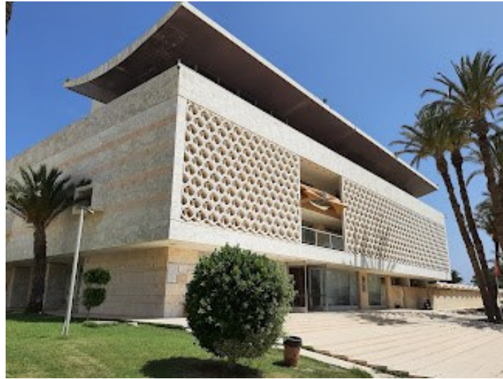
Fig.1. Façade de l'entrée du Palais de Skanès

C'est un palais d'été, édifié dans une palmeraie de mille palmiers et 40 hectares, un palais dont toutes les façades opaques ou en claustras sont en marbre blanc d'où son nom de palais de marbre. Il a été achevé le 3 août 1962 (date anniversaire de Habib Bourguiba) et classé Monument Historique en 2002. Son plan est carré, sur pilotis, entourant un patio carré fermé sur deux côtés (Nord, vers la mer et Est) par de larges galeries que rythme une colonnade monumentale. La façade d'entrée au Sud, protégée par des claustras est surmontée d'une couverture incurvée couvrant partiellement la terrasse et créant un séjour en plein air au-dessus de la cime des palmiers, avec vue sur la mer et l'horizon.