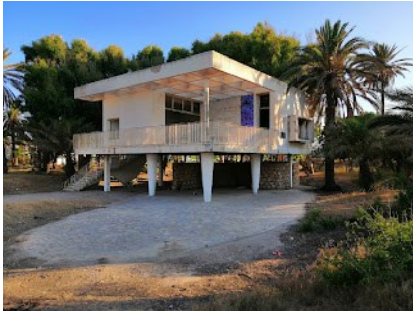
Fig. 3. Une des cinq villas des ambassadeurs.

Il y a aussi vers l'Est cinq petites villas proches de la mer, sur pilotis également, toutes légèrement différentes. Elles ne sont pas classées et très dégradées. Au niveau du sol des pilotis et un abri, pas de local de vie, pas de garage. A l'étage accessible par un escalier extérieur un séjour, deux ou trois chambres, une cuisine et une salle d'eau. Ce sont les villas des ministres, car c'est le gouvernement tout entier qui prend ses quartiers d'été à Skanès, avec le chef de l'Etat.