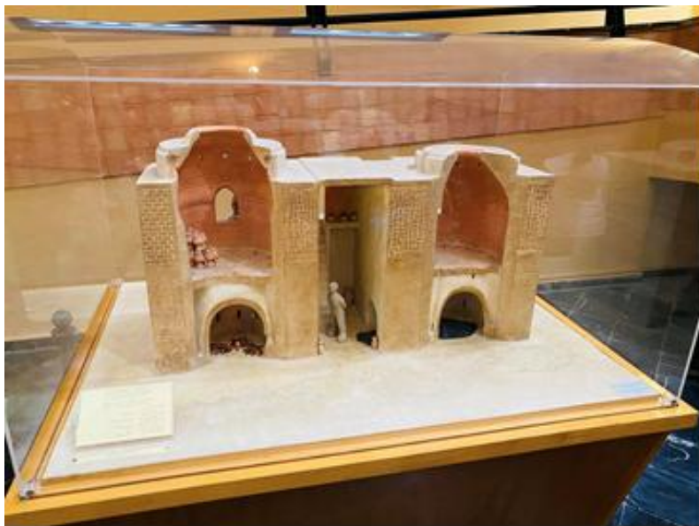
Fig. 12. Maquette de l'atelier de poterie traditionnelle à l'échelle 1/10 du Musée de Moknine.