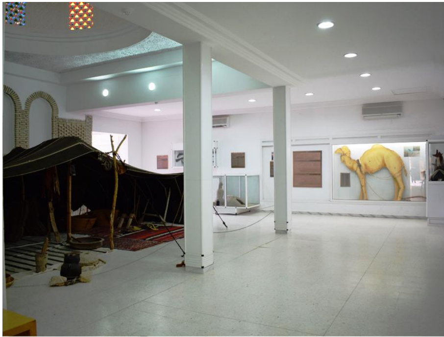
Fig. 9. Scène de la tente nomade, Musée du Sahara de Douz.