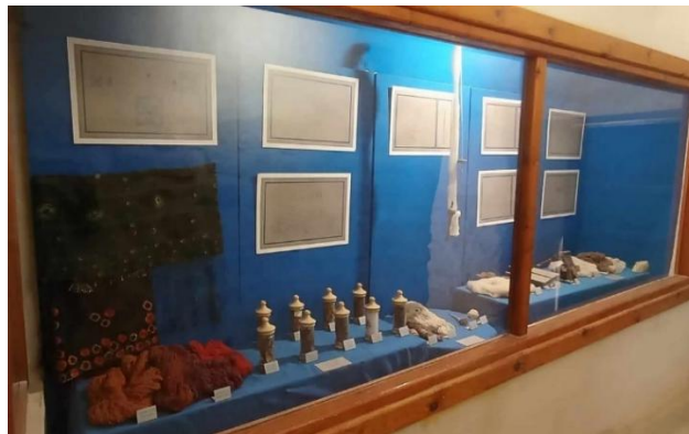
Fig. 7. Vitrine exposant le thème de tissage des femmes de la région de Gabès, musée ATP Gabès.