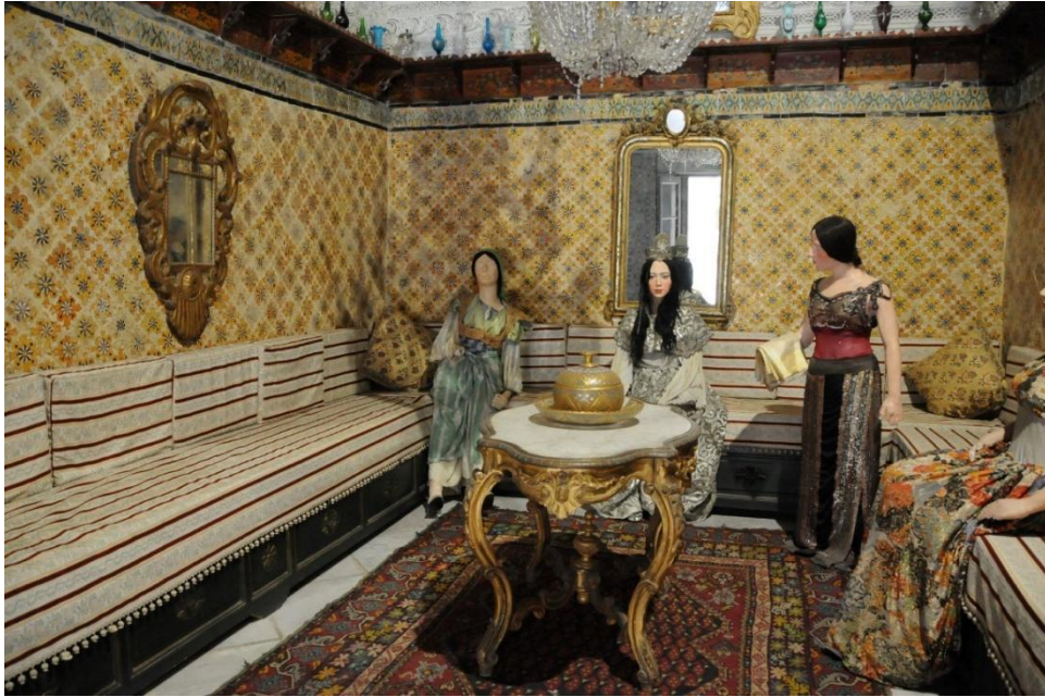
Fig. 1. Scène de la fête de mariage, dite aussi la chambre de la mariée, au musée Dar Ben Abdallah à la médina de Tunis.