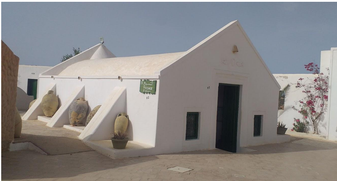
Fig. 20. Reconstitution de l'atelier de tissage, au musée Guellala à Djerba.

L'implantation du musée a revitalisé le village de Guellala, et sa proximité avec des ateliers traditionnels de poterie attire les visiteurs désireux d'observer les artisans à l'œuvre et d'acquérir des souvenirs en céramique traditionnelle.