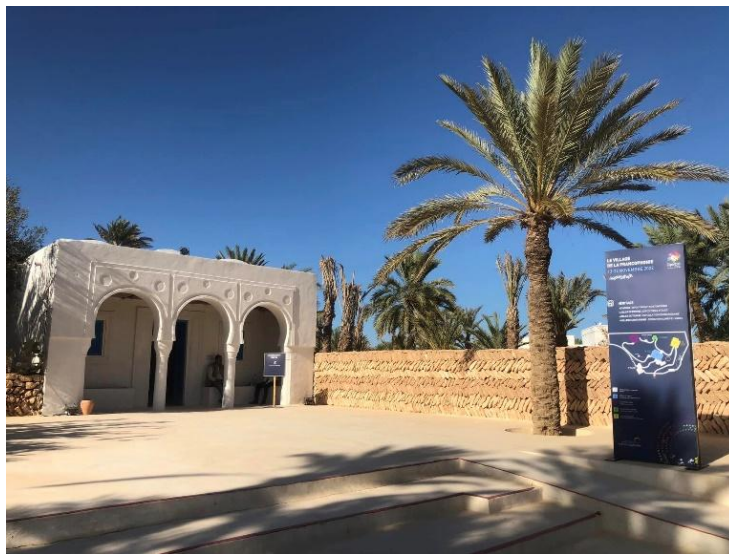
Fig. 26. Vue extérieure du houch de l'écomusée Djerba Héritage au complexe touristique Djerba Explore Parc.

Ces pavillons servent également de lieux d'activités interactives, comme des ateliers d'artisanat où les visiteurs peuvent apprendre des techniques traditionnelles voir figure 25). Ces expériences pratiques favorisent un engagement plus profond avec le patrimoine culturel, permettant aux visiteurs de s'appropriier les savoir-faire locaux. Les interactions vécues dans cet écomusée laissent une empreinte durable sur les visiteurs, enrichissant leur compréhension du monde et renforçant leur connexion avec Djerba.