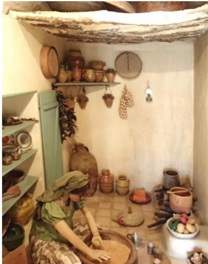
Fig. 2. Scène de la préparation du couscous, au musée el Kobba à la médina de Sousse.