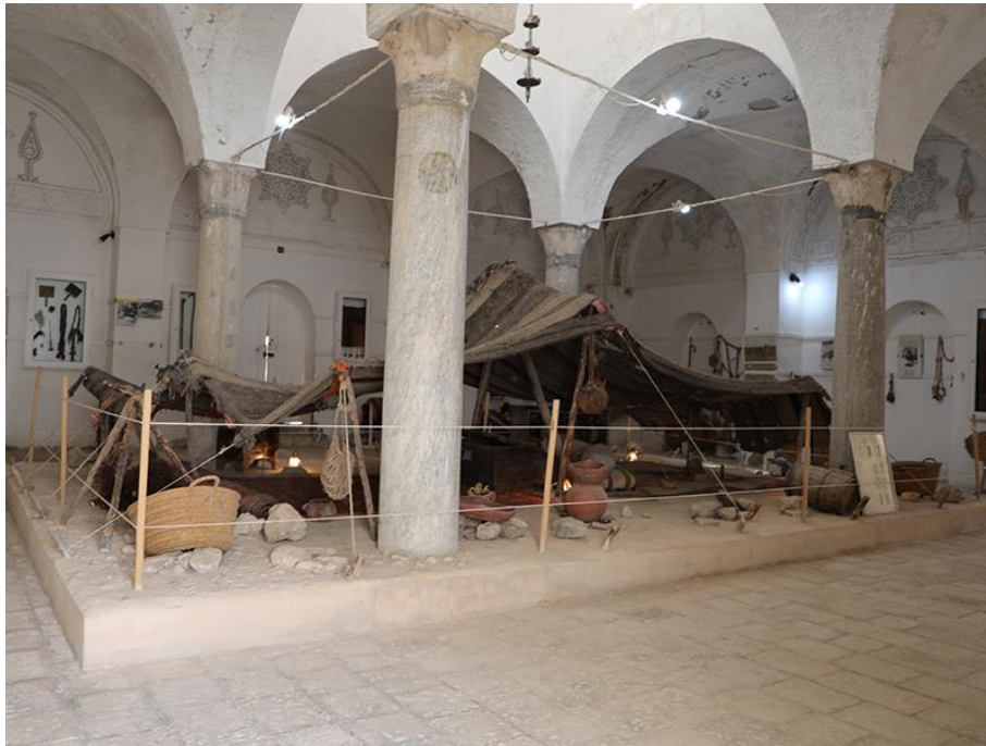
Fig. 5. Reconstitution de la tente des nomades, musée ATP du Kef.