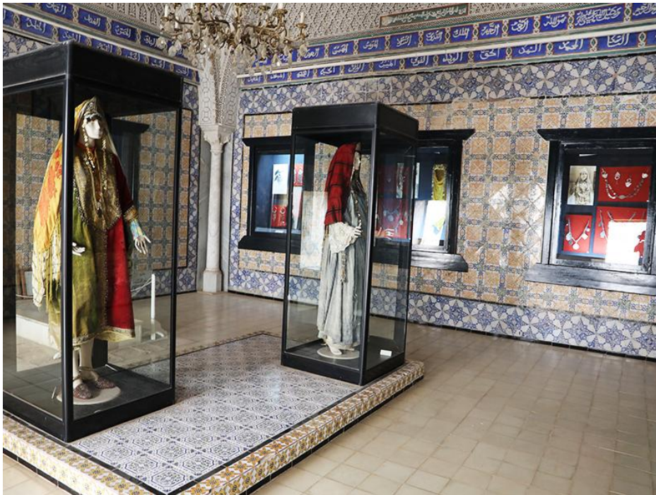
Fig. 4. Exposition de costumes féminins dans des vitrines, musée ATP du Kef.

Il convient également de souligner les difficultés liées à la conservation préventive des collections fragiles dans un bâtiment historique réaffecté. Les problèmes rencontrés lors de cette réaffectation ont conduit à envisager une nouvelle approche pour la création de musées du patrimoine traditionnel : celle de construire des édifices spécifiquement conçus pour respecter les normes muséographiques internationales tout en préservant l'option d'une exposition didactique avec scénographie à décor, qui a déjà prouvé son efficacité dans la médiation du patrimoine traditionnel en Tunisie.