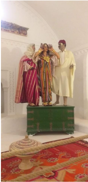
Fig. 21. Reconstitution de scènes de l'exposition au musée Guellala à Djerba.