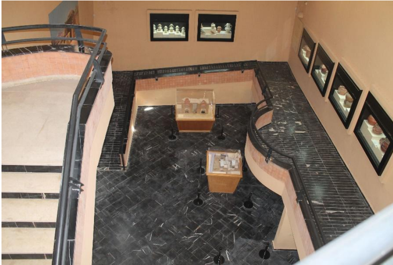
Fig. 11. L'ambiance spatiale moderne de l'aménagement muséographique du Musée de Moknine.