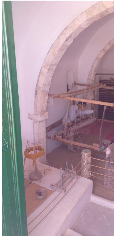
Fig. 22. Reconstitution de l'atelier de tissage au musée Guellala à Djerba.