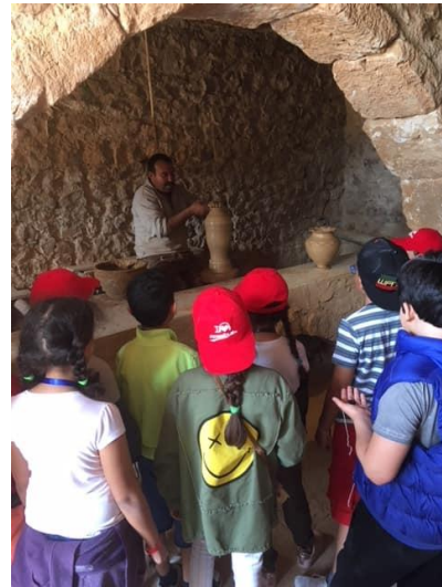
Fig. 25- l'atelier de poterie traditionnelle de l'écomusée Djerba Héritage au complexe touristique Djerba Explore Parc.