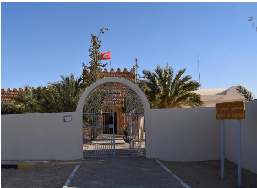
Fig. 8. Façade du Musée du Sahara de Douz.

De manière générale, tant la conception architecturale que l'aménagement muséographique des musées de Douz et de Moknine adoptent une approche fonctionnaliste visant à optimiser l'expérience de visite. Toutefois, dans le cas du musée de Douz, le lien entre l'enveloppe architecturale et la scénographie de l'exposition est relativement faible. Ce musée présente, à travers une série de tableaux synoptiques, le cadre de vie des nomades dans le désert de Nafzaoua, en exposant des collections d'objets ethnographiques liés au nomadisme dans cette région (tels que le dromadaire, la tente, le mobilier nomade, la cavalerie, le tissage et les costumes). Cependant, cette présentation se déroule dans un cadre spatial ordinaire qui ne fait pas écho à l'environnement thématique de l'exposition. La grande coupole et le revêtement décoratif en pierre pleine qui caractérisent le style architectural de ce musée semblent peu en rapport avec le désert, thème central de l'exposition (voir figure 9).