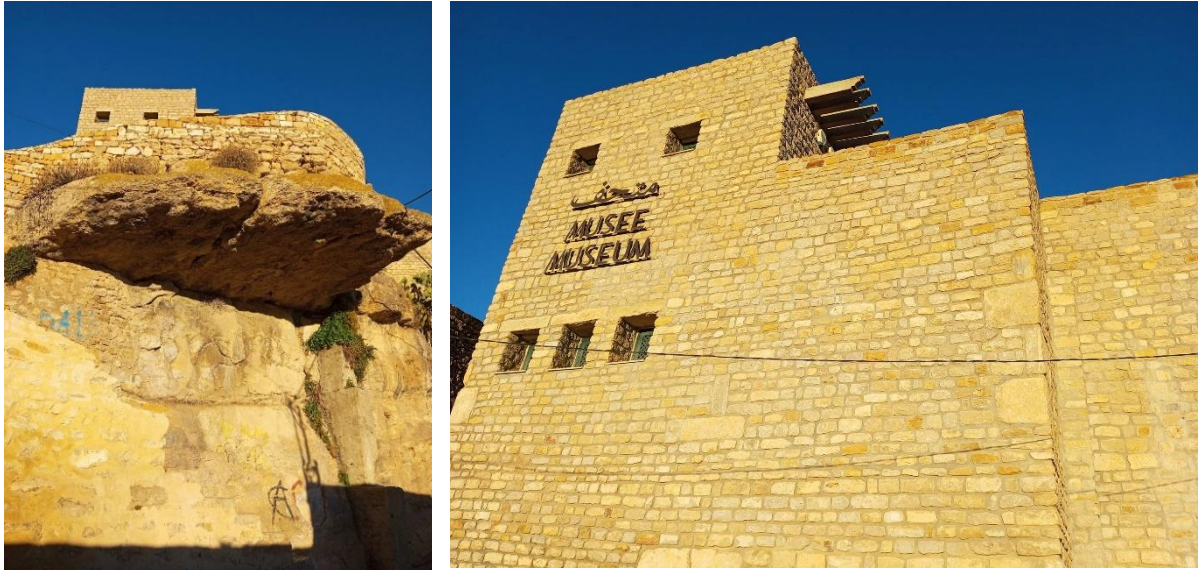
Fig.13 et 14. vues extérieures du Musée de Kesra.

supports d'éclairage, photographies, panneaux informatifs et explicatifs...), créant ainsi un contraste entre les styles traditionnel et contemporain (voir figures 15 et 16).