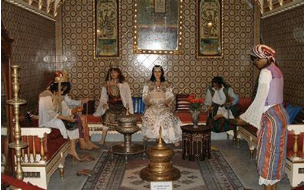
Fig. 3. Scène reconstituée de la vie domestique tunisoise au XIX e siècle, au musée Dar Chraïet à Tozeur.