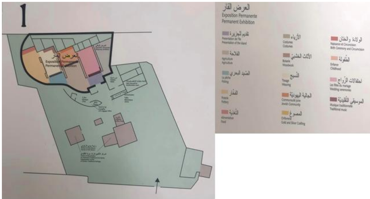
Fig. 17. Plan de l'aménagement muséographique du Musée du patrimoine traditionnel de Djerba.