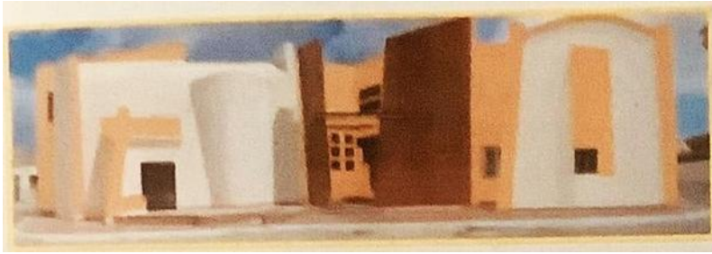
Fig.10. Image de synthèse de la façade du Musée de Moknine.