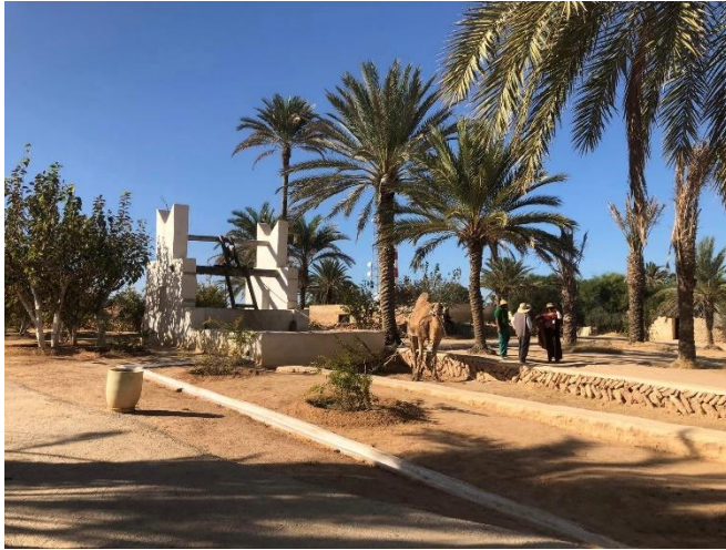
Fig. 24. Le verger de l'écomusée Djerba Héritage au complexe touristique Djerba Explore Parc. Source : Photo de l'auteur, 2018.

(animateurs de l'écomusée) qui s'activent dans des pratiques traditionnelles quotidiennes : tissage de la laine, tressage de fibres de palmier, broyage du blé, poterie et agriculture... 25