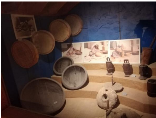
Fig. 6. Vitrine exposant le thème de transformation des produits alimentaire, musée ATP Gabès.