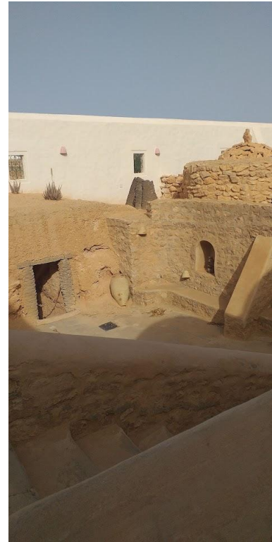
Fig. 23. Reconstitution de l'atelier de poterie au musée Guellala à Djerba.