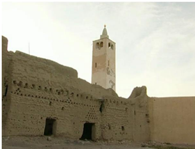
6. جامع سيدي المبارك، الصوعدة

إلى حياة الرفاه والتحضر، لا يتوقف عن زيارة العواصم القريبة، أي قسنطينة والجزائر وتونس. تزوج بمدينة تونس وكان يمتلك بها دارا يقيم فيها أثناء زيارته المتكررة لها.