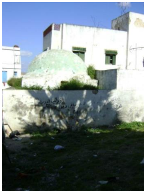
3. توجد زاوية سيدي ناجي، جد سيدي مبارك مؤسس الخنقة برحبة الخيل، بمدينة تونس

الحفيظ بن الطيب بن أحمد بن مبارك، وفي المقابل ازداد صيت الطريقة الرحمانية وزاوية سيدي عبد الحفيظ وذلك نظرا إلى الشهرة الكبيرة التي يتمتع بها الشيخ المجاهد عبد الحفيظ الونجلي.