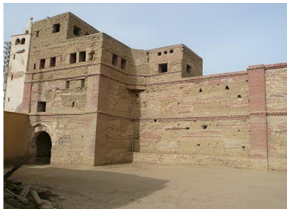
4. يمتلك شيخ الزاوية قصر، يسمّى السراية، لا يقل أبهة عن القصور الملكية