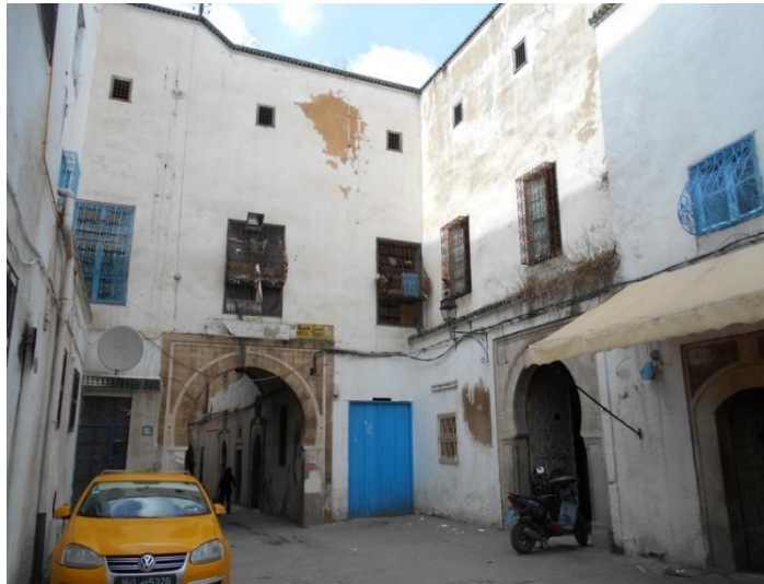
Fig. 3. La placette de Ben Ayed menant au Centre d'Enseignement d'Art et donnant sur l'avenue de Bâb Jedid.

auquel s'associe le musée où « les artistes y trouvent les documents indispensables à leur enseignement ».