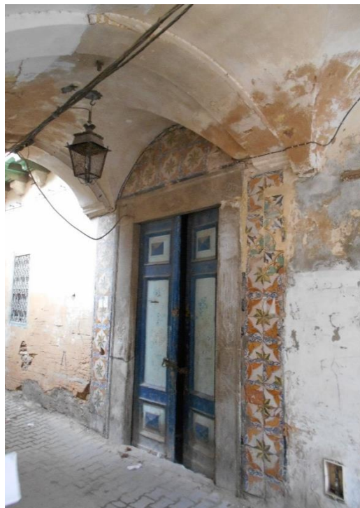
Fig. 1. L'entrée principale et unique du Centre d'Enseignement d'Art de Tunis située au Passage Ben Ayed dans le quartier de Bâb Jedid à proximité du Tourbet el-Bey.

En Tunisie, la création des établissements d'enseignement spécialisés dans la formation des architectes n'a eu lieu qu'à partir du début du XX e siècle à travers la fondation du Centre d'Enseignement d'Art de Tunis en 1923. Parallèlement à l'enseignement de peinture, cet établissement a assuré un enseignement de l'architecture 3 qui n'a duré que sept ans pour être suspendu en octobre 1930. Dès lors, le Centre d'Enseignement d'Art a pris le nom d' Ecole des Beaux-arts de Tunis 4 en assurant un enseignement de peinture et d'arts plastiques 5 . Malgré sa courte durée, cette expérience pédagogique a permis la formation des premiers architectes Tunisiens.